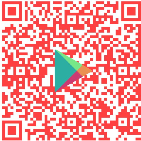
Google Play Store (Android)