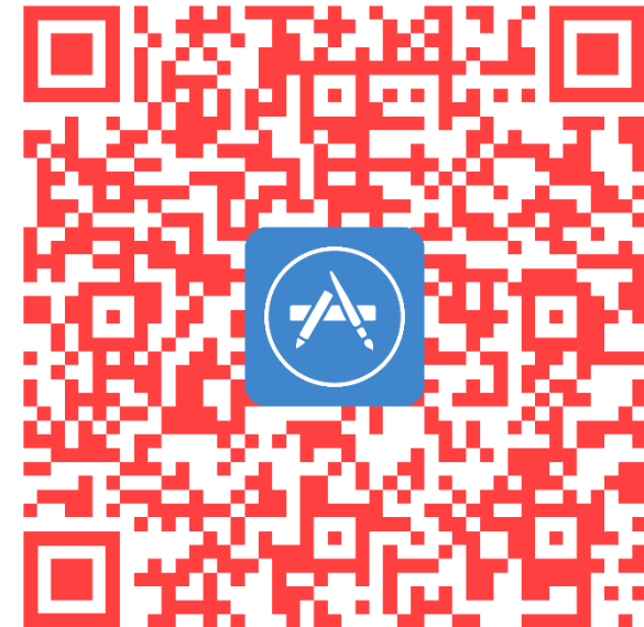
App Store (Iphone)